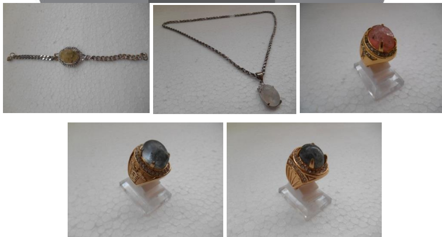
Gambar 5 Rekomendasi Produk Hasil eksplorasi