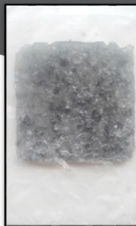
Gambar 2 Resin

Berdasarkan hasil analisis modul eksplorasi limbah kaca yang diolah dengan menggunakan berbagai macam bahan perekat memiliki kelebihan dan kekurangan sendiri dan yang memungkinkan untuk dilakukan.