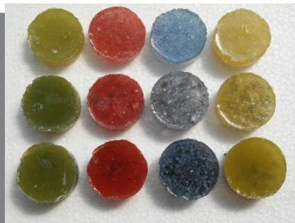
Gambar 4 Eksplorasi Lanjutan