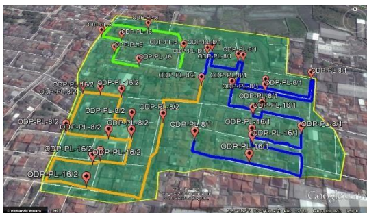
Gambar 4.3 Distribusi perancangan

Perhitungan redaman untuk jaringan ini dibutuhkan karena dengan didapatkannya redaman yang sesuai dengan range yang ditentukan yaitu 13 – 25 dB maka jaringan tersebut bisa dikatakan bagus atau tidak akan terjadi gangguan secara teknikal dari media transmisi.