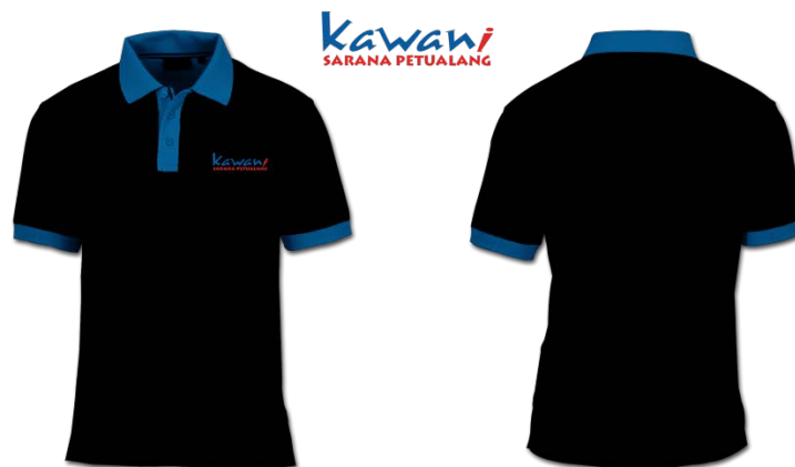
Gambar 16. Seragam pegawai