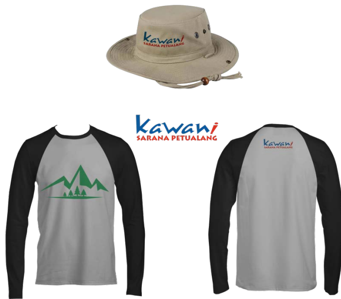
Gambar 17. Merchandise