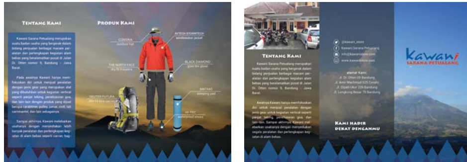
Gambar 12. Brosur