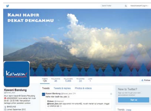
Gambar 7. Tampilan twitter