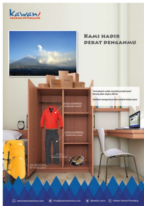
Gambar 11. Poster