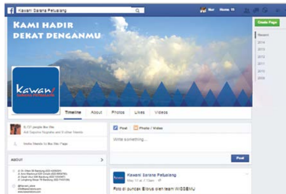
Gambar 6. Tampilan facebook