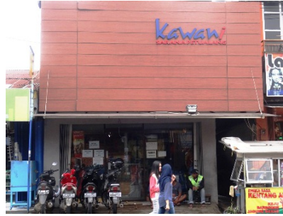
Gambar 1. Cabang Kawani (Dipatiukur)

Kawani sendiri tidak memproduksi produk dengan merek mereka sendiri, melainkan mereka hanya memperolehnya dari kota Jakarta dan sebagian lagi mengimpor langsung produk dari produsen pusat yang kemudian Kawani menjualnya kembali demi mendapatkan profit dari penjualannya tersebut. Oleh karena itu disini peran dari Kawani sebenarnya adalah sebagai reseller produk dari brand-brand lokal dan interlokal saja.