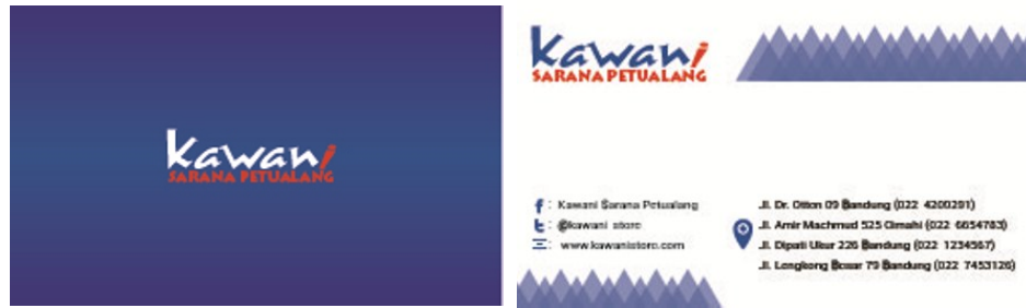
Gambar 4. Kartu nama