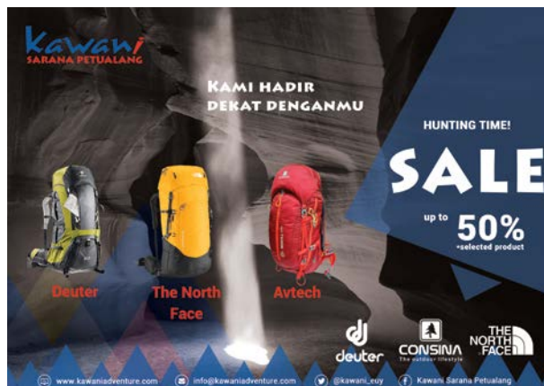
Gambar 14. Digital poster