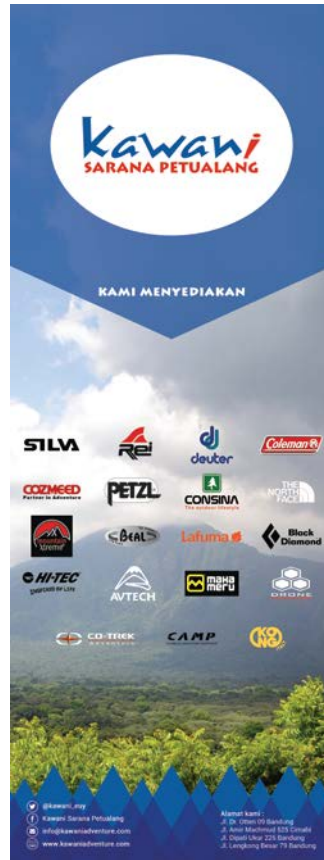
Gambar 15. X-banner