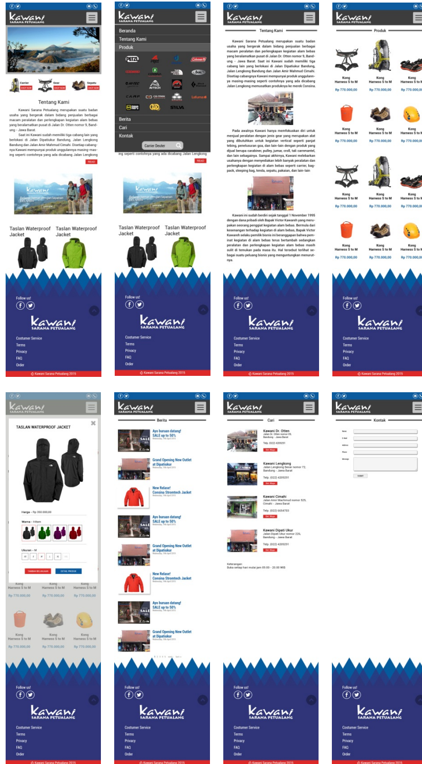
Gambar 9. Mobile website