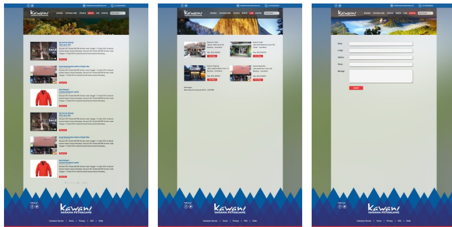
Gambar 8. Tampilan website