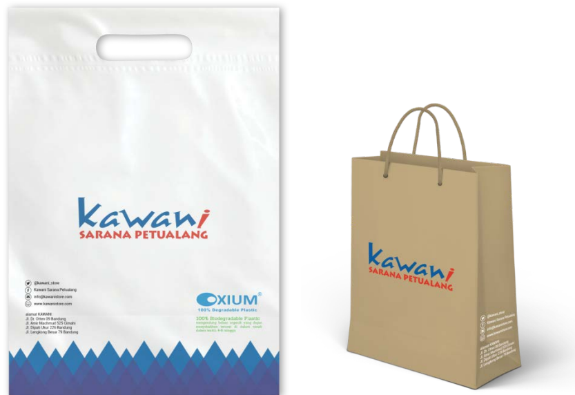
Gambar 10. Tas Belanja