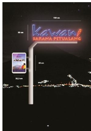
Gambar 3. Papan nama