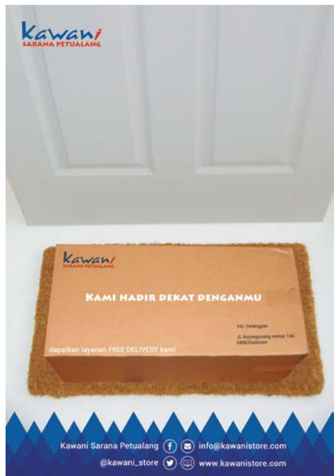
Gambar 13. Iklan majalah