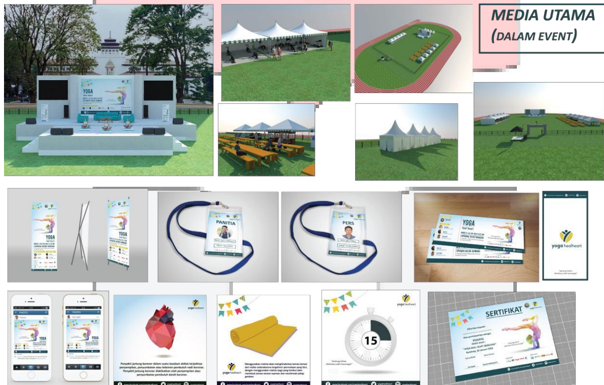
Gambar 6. Media Utama

Dengan menggunakan strategi media melalui AISAS ( Attention, Interst, Search, Action and Share ) kampanye ini akan lebih mengenai target sasaran karena sebelumnya juga telah diperoleh data mengenai consumer journey yang membuat pemilihan media sesuai. Dalam kampanye ini tahapan action nya adalah melalui sebuah event yang bertujuan untuk mengajak dan menginformasikan pencegahan penyakit jantung melalui olahraga yoga. Tidak hanya event yang menjadi media namun juga terdapat media pra event dan juga pasca event yang membantu menginformasikan pesan kampanye ini.