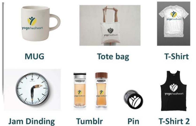
Gambar 8. Merchedise event