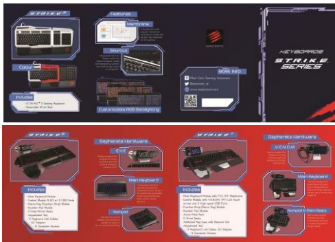
Gambar 7. Brosur S.T.R.I.K.E. Series