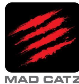
Gambar 1. Logo Mad Catz