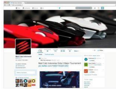
Gambar 16. Twitter