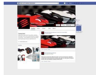
Gambar 17. Facebook