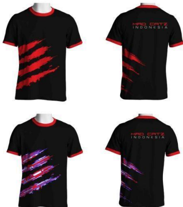
Gambar 22. Souvenir