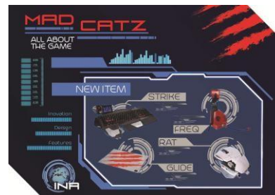
Gambar 11. Poster