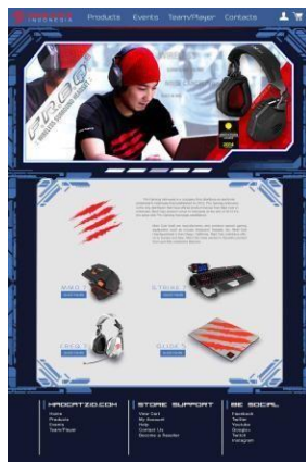
Gambar 15. Website