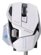
Gambar 3. Refrensi Foto Produk Mad Catz [5] 07-04-2015. 9:37)

Unsur lainnya yang digunakan dalam perancangan visual adalah desain atau bentuk produk yang futuristic . Unsur futuristic akan ditampilkan melalui foto-foto produk yang mewakili karakter dari Mad Catz.