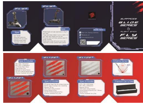
Gambar 8. Brosur G.L.I.D.E. & F.L.Y. Series