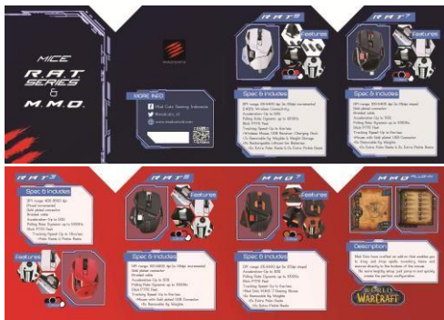
Gambar 6. Brosur R.A.T. Series