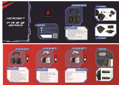
Gambar 9. Brosur F.R.E.Q. Series