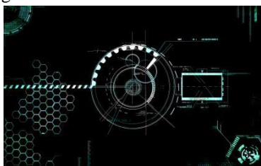
Gambar 4. Refrensi Motif Futuristic (sumber: www.wallpaperup.com ) [6], 07-04-2015. 9:40)

Selain itu, dipergunakan juga motif-motif futuristic untuk memperkuat kesan futuristic pada perancangan.