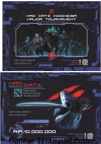
Gambar 21. Digital Poster