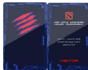
Gambar 19. Ticket Event