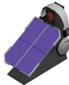
Gambar 10. Display Brosur