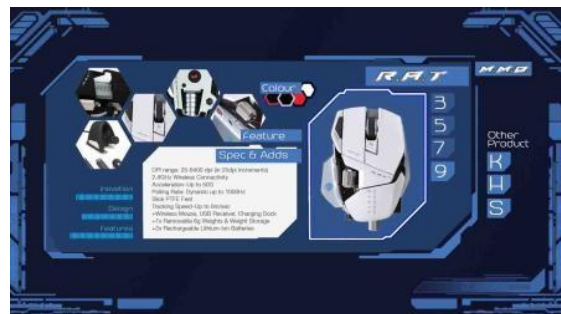
Gambar 18. Interactive Media