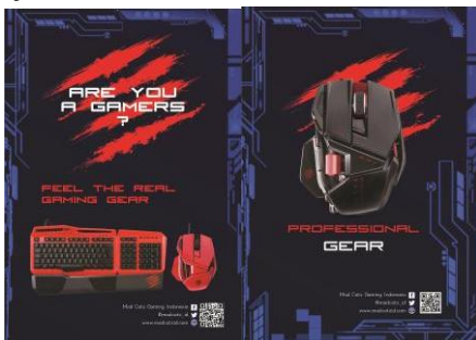
Gambar 13. Majalah