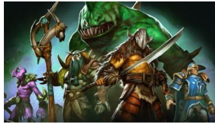
Gambar 5. Refrensi Karakter pada Game [7], 09-04-2015. 4:07)

Unsur game yang digunakan dalam perancangan visual merupakan visualisasi dari beberapa karakter game yang sedang populer dimainkan di kalangan yang sesuai dengan target konsumen dan karakter dari game yang sesuai untuk dijadikan media untuk mempromosikan produk. Selain karakter, unsur gameplay pada game juga akan diikuti sertakan dalam perancangan visual.