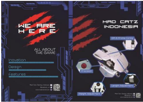
Gambar 12. Digital Poster