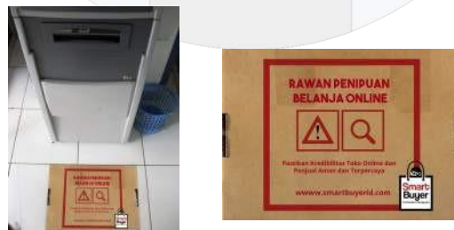
Gambar 4. Stiker Paket dan Pengaplikasiannya

Menggunakan visual paket yang biasa digunakan dalam belanja online sebagai sarana pengiriman barang. Menggunakan stiker yang dibuat seperti dengan paket pada umumnya yang kemudian ditempelkan di lantai ATM dengan fungsi menciptakan awareness dan juga untuk mengingatkan konsumen sebelum melakukan transfer kepada penjual untuk cek kredibilitas toko online dan penjualnya apakah terpercaya atau tidak agar terhindar dari penipuan. Pemilihan ATM sebagai penempatan media sesuai dengan point of contact target audiens yang sering menggunakan transfer via ATM ketika melakukan pembayaran saat belanja online .