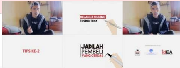
Gambar 6. Screenshoot Video Tips Belanja Online Anton

Video ditempatkan di youtube dalam official account kampanye dan di dalam webiste kampanye. Video ini berdurasi sekitar 1-2 menit. Video ini juga akan menjadi iklan sela di dalam youtube . Video ini nantinya akan mengarahkan target audiens ke media utama yaitu website .