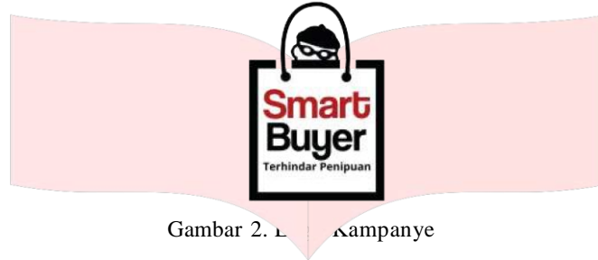
Gambar 2. Logo kampanye

Logo kampanye yang telah dirancang menggunakan visual sesuai dengan maksud dari kampanye ini yaitu menjadi pembeli cerdas agar terhindar dari penipuan dalam hal ini adalah belanja online . Maka logo identitas kampanye yang dibuat mengandung unsur-unsur dari kegiatan belanja seperti tas belanja dan juga ada ikon penipu sebagai sesuatu yang harus kita waspadai dalam belanja online . Ikon penipu sengaja diletakan sembunyi-sembunyi untuk merepresentasikan penipu memang sembunyi-sembunyi dalam melancarkan aksinya.