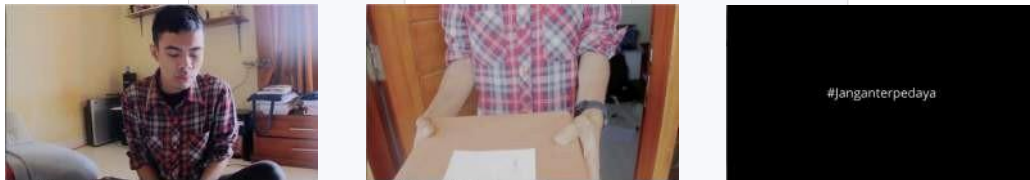
Gambar 3. Video Teaser

Video teaser berdurasi kurang lebih 20 detik merupakan ringkasan video yang ada di tahap interest yang akan disebarakan melalui akun Line Shopping untuk menciptakan word of mouth yang selanjutnya target audiens akan masuk ke tahap interest untuk mendapatkan cerita lengkapnya.