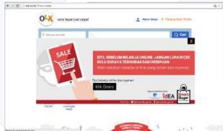
Gambar 7. Pop Up Ads

Pop up ads akan muncul disetiap situs belanja online yang berfungsi untuk mengingatkan kepada konsumen yang ingin berbelanja online agar waspada dan berhati-hati sebelum melakukan transaksi agar terhindar dari penipuan. Selain itu pop up ads ini juga mengarahkan ke media utama yaitu website .