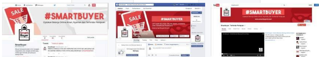
Gambar 11. Media Sosial

Untuk mendukung target audiens untuk membagikan informasi yang telah mereka terima maka dibuat media dimana mereka dapat memberikan informasi dan menyebarkan kampanye ini. Media sosial yang digunakan adalah facebook , twitter , dan youtube yang merupakan media sosial yang sering digunakan oleh khalayak sasaran.