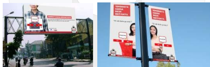
Gambar 9. Bandau dan Street Banner

Kedua media luar ini ditempatkan di tempat strategis yang biasa dilewati oleh target audiens ini untuk mengarahkannya ke media selanjutnya.