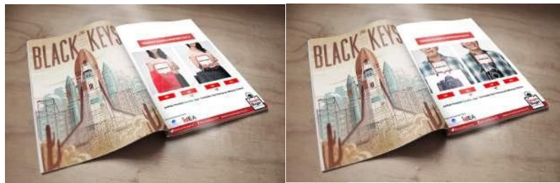
Gambar 8. Poster, Flyer, Iklan Majalah

Menampilkan visual dengan gaya komparasi melalui pendekatan teknologi dibuat seperti sedang belanja online . Sesuai dengan pesan komunikasi dengan insight ingin menjadi eksis atau gaya dan penyebab utama penipuan saat belanja online ini adalah tergiur harga murah maka pada visual yang dibuat mengajak target khalayak untuk berpikir jika tidak hati-hati dan tidak mengecek dulu kredibilitas toko online nya maka akan menjadi korban penipuan dan gagal eksis sehingga jadi mati gaya. Headline yang terdapat dalam print ad ini yaitu: “terpedaya harga bikin mati gaya”. Subheadline dalam print ad ini yaitu: “cek terlebih dahulu kredibilitas toko online dan penjual agar terhindar dari penipuan saat belanja online ”. Print ad ditempatkan di majalah yang sering dibaca target audiens seperti gogirl, gadis, dan lain sebagainya. Selain itu print ad berupa poster dan flyer di tempatkan di konter pulsa sesuai dengan point of contact