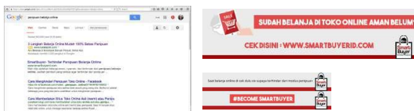
Gambar 10. Web Banner, Mobile Banner, dan SEO