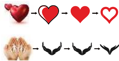
Gambar 3. Transformasi hati dan tangan

hati dan tangan sebagai simbol kesadaran dan kepedulian terhadap kota Bandung.