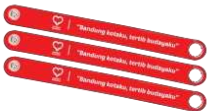
Gambar 16. Notes