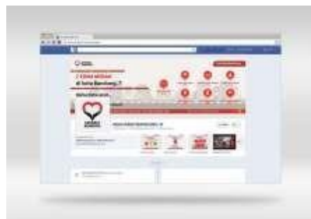
Gambar 19. Facebook #sahabatbandung