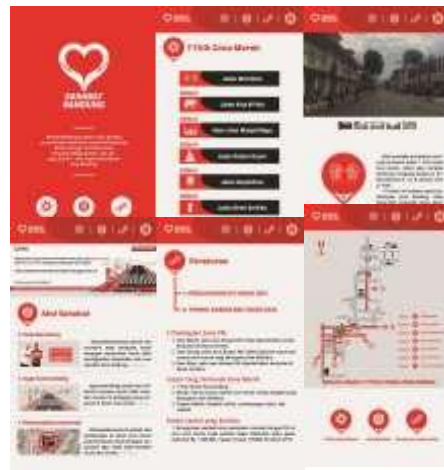
Gambar 18. Aplikasi #sahabatbandung