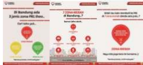
Gambar 5. Poster #sahabatbandung