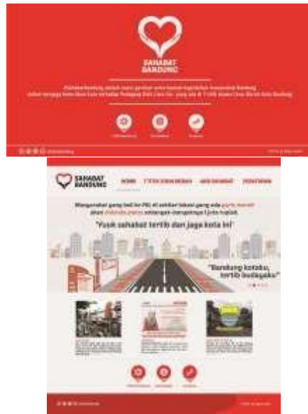
Gambar 17. Website #sahabatbandung