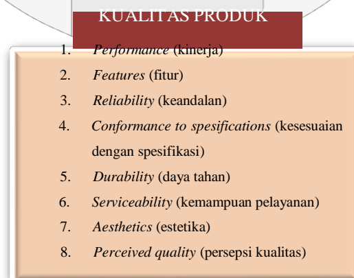
Gambar 2. Kerangka Pemikiran

Delapan dimensi kualitas produk yang telah dijabarkan akan digunakan untuk mengetahui pendapat kosnumen tentang kualitas produk PC tablet iPad Air 2 dan Samsung Galaxy Tab S 10.5. Hasil penelitian ini dapat diketahui ada atau tidaknya perbedaan kualitas produk kedua PC tablet menurut konsumen, sehingga setiap perusahaan dapat membuat strategi untuk mempertahankan atau meningkatkan kualitas pada produk masing-masing. Berikut adalah kerangka pemikiran penelitian yang digunakan: