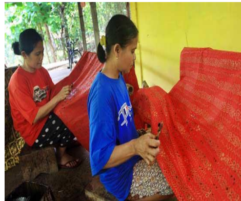
Gambar 2.4 proses pencantingan http://motif.com/kerajinan-canting-Riau.html