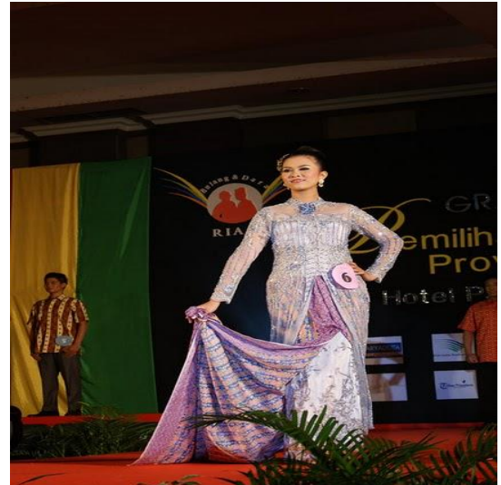
Gambar 2.7 kain batik Riau setelah menjadi steelan kebaya http://batik.com/kerajinan-batik-tulis-Riau.html

11. Ini adalah Batik tulis tabir Riau setelah menjadi Bawahan kebaya modern.