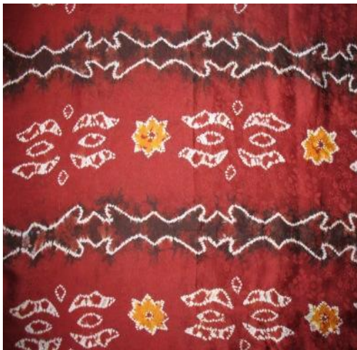
Gamabr 2.6 batik tulis Riau http://batik.com/kerajinan-batik-tulis-Riau.html

10. Setelah kering, untuk merapikan kain yang telah dijemur tersebut lalu disetrika, setelah selesai lalu dapat digunakan sesuai kebutuhan.