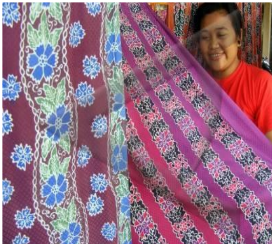
Gambar 2.2 batik cap