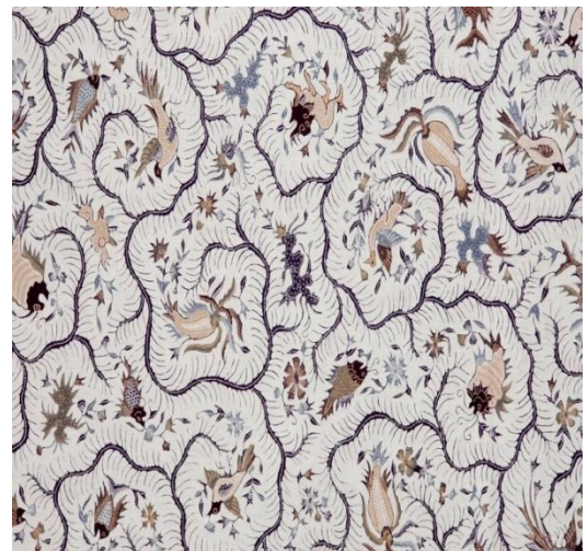
Gambar 2.8 kain batik tulis

Batik tulis Riau “itik pulang petang”Ini telah melalui banyak proses dan Kini telah menjadisehelai kain batik.