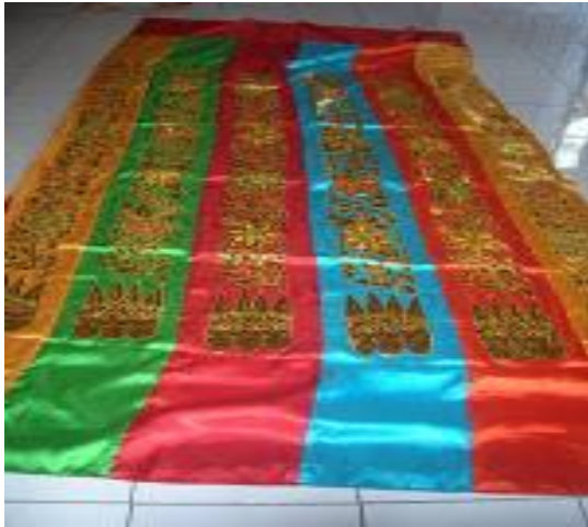
Gambar 2.3 motif pelaminan http://motif.com/kerajinan-pelaminan-Riau.html