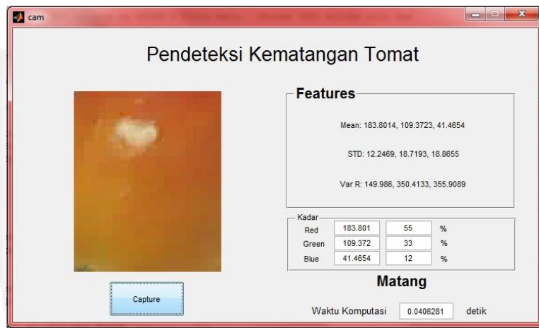
Gambar 3. 3 Pendeteksi Kematangan Tomat

Pada Desain GUI ( Graphical User Interface ) pada matlab ada 9 hasil yang ditampilkan yaitu nilai fitur dari mean, varian, standar deviasi, nilai kadar RGB, keputusan dan waktu komputasi dari sistem. Tombol capture pada tampilan digunakan mengaktifkan webcam untuk langsung melakukan pengambilan citra.