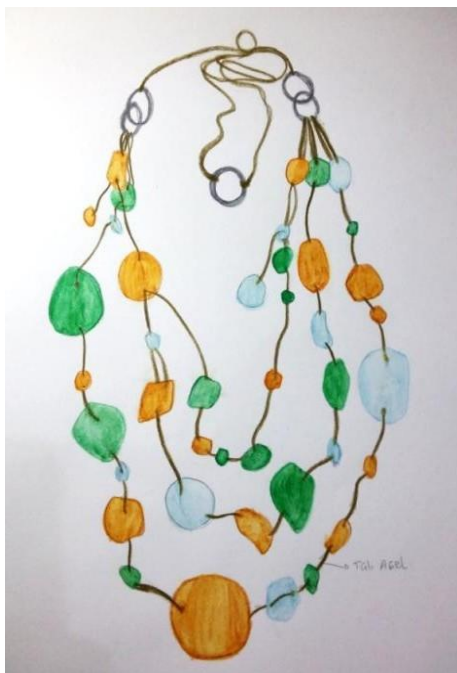
Gambar 4. Sketsa Desain Kalung Matinee (Sumber: Dokumen Pribadi, 2016)

Ekplorasi yang dilakukan dalam penelitian ini adalah untuk menghasilkan bentuk dan tekstur baru, kemudian pecahan yang sudah diolah menjadi bentuk baru akan dilubangi terlebih dahulu dan kemudian pecahan kaca tersebut siap dipakai untuk proses pembuatan aksesoris, berikut tabel eksplorasi yang dilakukan: