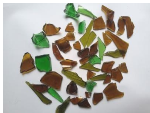
Gambar 6. Kaca Yang dihaluskan