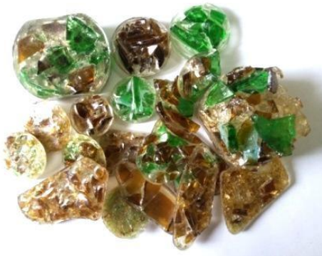
Gambar 9. Gabungan Kaca Menggunakan Resin

5. Eksplorasi menggabungkan pecahan kaca kecil menggunakan resin.