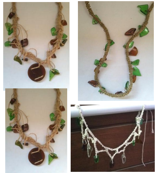
Gambar 11. Penggabungan Bandul

Bandul yang sudah siap akan digabungkan dengan menggunakan material lain berupa benang dan serat alam.