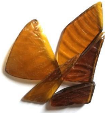
Gambar 8. Kaca yang Telah di Motif

4. Memberikan tekstur dan motif pada kaca dengan alat engrave pen