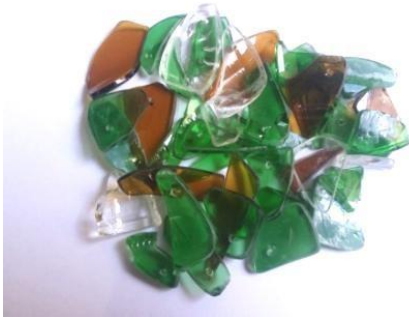
Gambar 7. Kaca Yang Telah Dilubangi

3. Melubangi Kaca Sebagai Akses Masuknya Material Penunjang seperti Tali