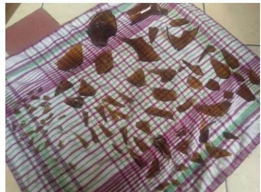
Gambar 5. Pecahan Kaca Botol