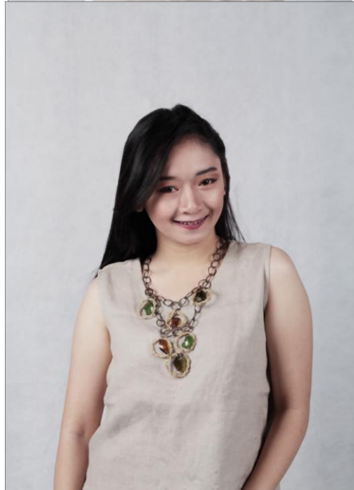
Gambar 12. Hasil Kalung