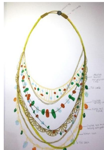
Gambar 2. Sketsa Desain Kalung Bib