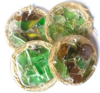
Gambar 10. Gabungan Kaca dengan Resin dan Akar

6. Gabungan Kaca dengan resin dan hiasan akar. akar.