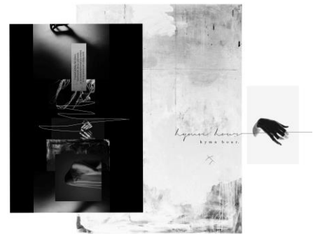
Gambar 1. Konsep Tema

tidak stabil dan kesan yang terombang-ambing antara kata hati dan kendali dirinya atau hal yang tidak dapat terkendali antara pikiran dan emosinya.