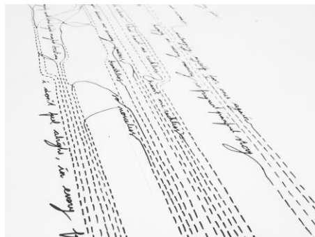
Gambar 4. Eksperimen Bordir

putih sebagai bentuk estetika dan dilakukan dengan menggunakan mesin bordir, jahitan-jahitan pada bordir menggunakan teknik tusuk lurus yaitu untuk membuat garis lurus maupun garis putus-putus yang terdapat pada desain. Serta menggunakan teknik tusuk zig-zag yaitu untuk membentuk huruf-huruf dan garis yang non geometris yang terdapat pada desain.