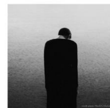
Gambar 6. Puisi Inanimate State