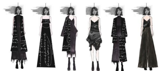
Gambar 3. Ilustrasi

Mengandung unsur fesyen yang klasik, perancangan ini memiliki karakter dramatic classicism yaitu perpaduan unsur dramatis dengan siluet basic . Perancangan ini menggunakan gaya perancangan dengan detail spaghetti tank , flare silhouette , A-line , oversized , unfinished texture .