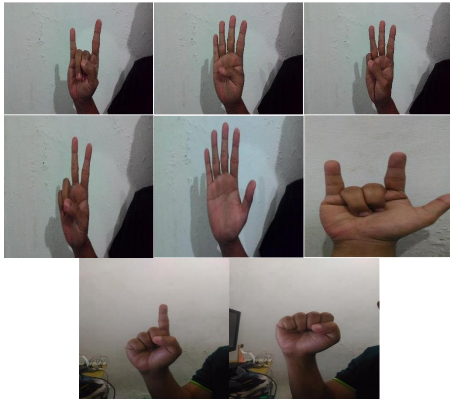
Gambar 3. 2 Perancangan Pola tangan

Dalam system terlebih dahulu harus menentukan pose pose yang akan dideteksi untuk dijadikan sebagai input untuk menggerakkan alat. Untuk itu dipilihlah 8 pose seperti gambar di atas. Setelah itu pose pose ini di latih menggunakan haar cascade classifier untuk mendapatkan xml yang nantinya akan digunakan sebagai deteksi dalam system ini.