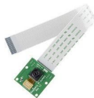
Gambar 2. 1 Raspberry Pi Camera Module

Raspberry Pi camera module berukuran 25 x 20 x 9 mm dan menempel melalui kabel pita sepanjang 15 cm ke port CSI (Camera Serial Interface) pada Raspberry Pi . Kamera memiliki resolusi 5MP seperti yang terdapat pada kamera ponsel saat ini. bekerja dengan semua model Raspberry Pi [2].