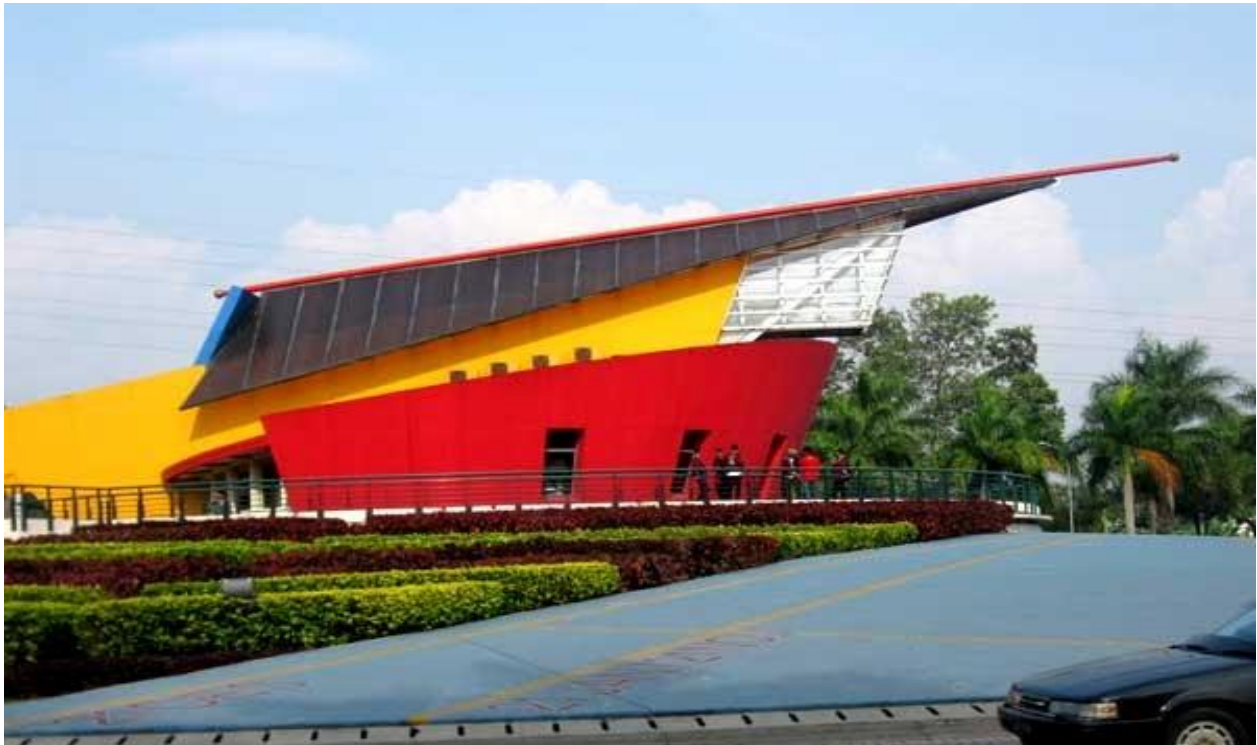
Gambar 1. Museum Puspa Iptek (Pusat Pengetahuan Ilmu Teknologi)

Peletakan pencahayaan lampu pada Museum puspa iptek ini merupakan peletakan lampu secara general tidak menggunakan pencahayaan spesial pada pengaplikasiannya, penelitian ini berfokus pada besaran cahaya yang digunakan pada museum Puspa Iptek dimana pengukuran pencahayaan berdasarkan besaran lux dijadikan patokan perhitungan besaran cahaya yang disesuaikan dengan literature yang berhubungan