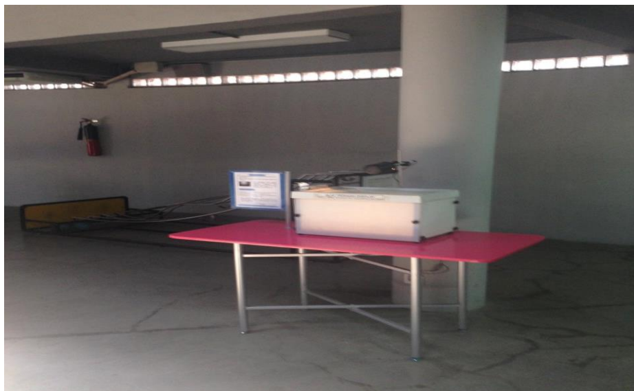
Gambar 5. Pencahayaan pada objek display