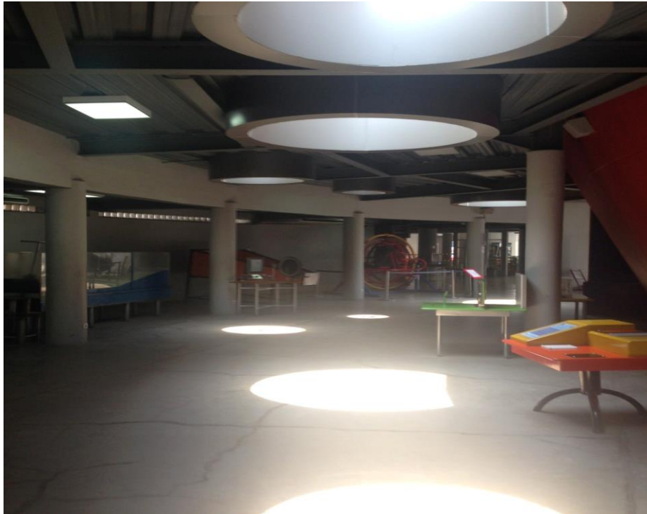
Gambar 4. Pencahayaan pada ruang display lorong

Pencahayaan pada objek pun sangat minim sehingga kekhusan perawatan terhadap pencahayaan tidak diperhatikan mengingat objek display pada umumnya seharusnya diberi kekhususan pencahayaan guna memberikan estetika maupun pengkondisian kondisi area sekitar dalam hal ini suhu dan pencahayaan.