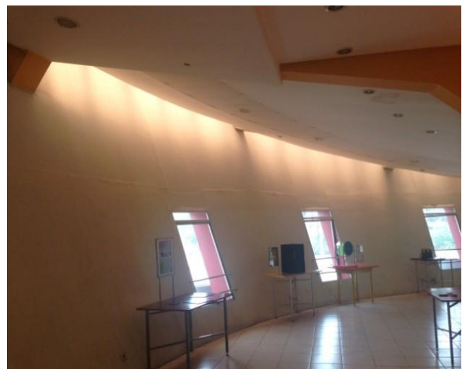
Gambar 3. Pencahayaan area display atas