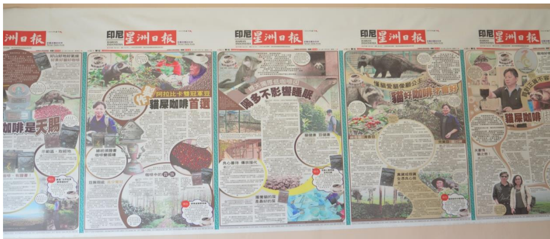
Gambar 1.1 Harian Indonesia di Luar Negeri

Berikut merupakan koran harian Indonesia di China, yang memaparkan tentang kesuksesan dalam penjualan Kopi Malabar ke luar negeri.