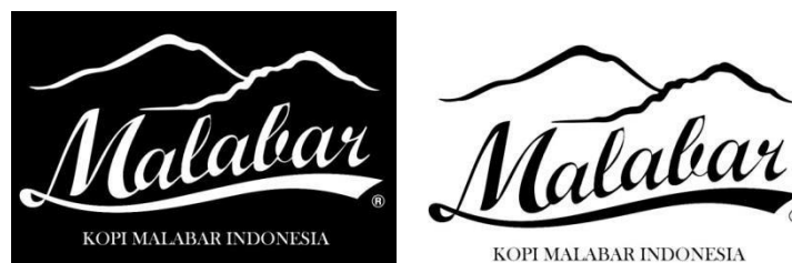
5.1 Penyederhanaan Logo Kopi Malabar Indonesia