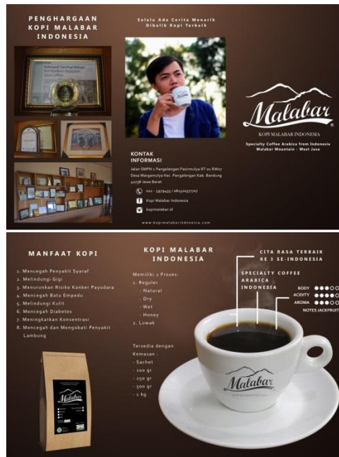
5.3 Leaflet Kopi Malabar Indonesia