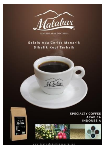
5.2 Poster Kopi Malabar Indonesia