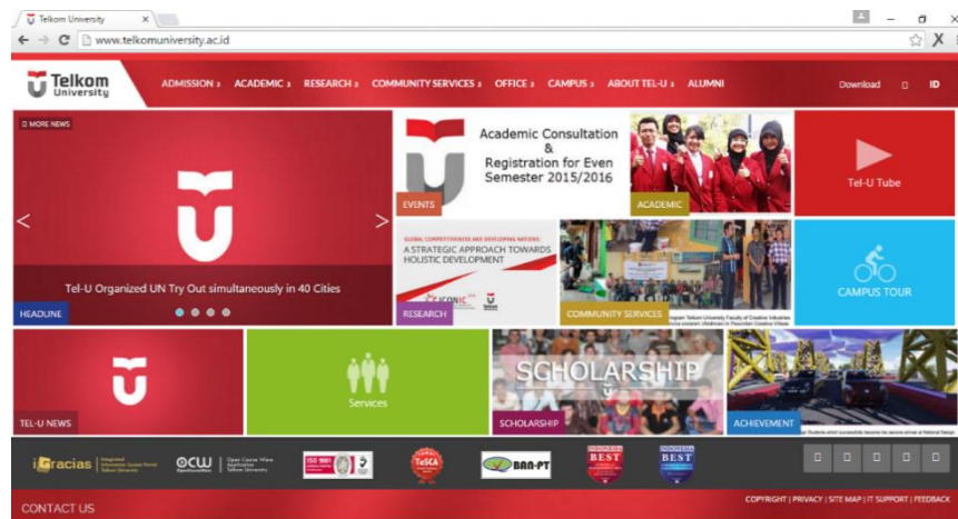
Gambar 1.1 Official Website Telkom University