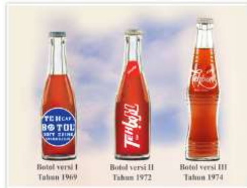
Gambar 1. 1 Logo Teh botol Sosro

bottle packaging has experienced three changes. The packaging versions are displayed in the image as follows :