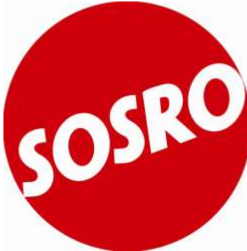
Gambar 1. 2 Logo Perusahaan Sosro