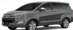
Gambar 1.6 Kijang Generasi Keenam