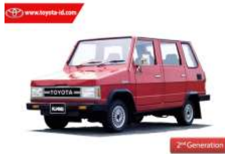
Gambar 1.2 Kijang Generasi Kedua

Generasi ketiga Toyota Kijang adalah penyempurnaan dari Kijang generasi kedua untuk model MPV maupun pick up . Pada generasi ketiga ini Toyota menggunakan teknologi Pressed Body sehingga dapat mengurangi bobot kendaraan hingga 5 kg. Pada generasi ketiga ini Toyota mulai bergeser dari kendaraan niaga ke kendaraan penumpang. Pada generasi ke tiga ini Toyota juga mulai menggunakan logo khas yang digunakan hingga hari ini. Perubahan besar besaran terjadi pada sisi interior, eksterior dan juga mesin. Dari sisi interior dashboard mengalami perubahan dan juga mendapat tabahan tachometer, penambahan fender, Power Window, Alloy Wheel bermerek Enkei, dan AC double blower. Sementara dari sisi mesin Kijang generasi ketiga ini Toyota memperkenalkan mesin baru yaitu 5 kecepatan. Sehingga Kijang hadir dalam dua pilihan mesin yaitu 4 kecepatan dan 5 kecepatan. Kijang generasi ketiga ini berhasil membukukan angka penjualan sebanyak 492.123 unit.