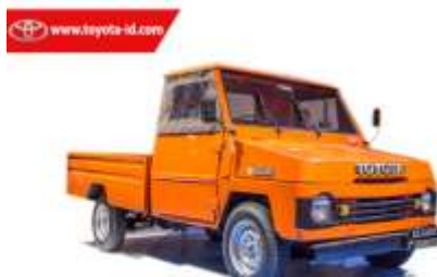
Gambar 1.1 Kijang Tahun Pertama

Generasi pertama Toyota Kijang menerapkan konsep pickup dengan bentuk kotak mendasar. Model ini sering dijuluki "Kijang Buaya" karena tutup kap mesinnya yang dapat dibuka sampai ke samping. Kijang generasi perdana ini diproduksi hingga pada tahun 1981 . Generasi pertama Kijang ini menggunakan mesin tipe 3K berkeuatan 1.200 Liter (1,166 cc) dengan empat transmisi. Tercatat generasi pertama ini membukukan penjualan sebanyak 26.806 unit di seluruh Indonesia.