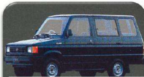
Gambar 1.3 Kijang Generasi Ketiga

Generasi ketiga Toyota Kijang adalah penyempurnaan dari Kijang generasi kedua untuk model MPV maupun pick up . Pada generasi ketiga ini Toyota menggunakan teknologi Pressed Body sehingga dapat mengurangi bobot kendaraan hingga 5 kg. Pada generasi ketiga ini Toyota mulai bergeser dari kendaraan niaga ke kendaraan penumpang. Pada generasi ke tiga ini Toyota juga mulai menggunakan logo khas yang digunakan hingga hari ini. Perubahan besar besaran terjadi pada sisi interior, eksterior dan juga mesin. Dari sisi interior dashboard mengalami perubahan dan juga mendapat tabahan tachometer, penambahan fender, Power Window, Alloy Wheel bermerek Enkei, dan AC double blower. Sementara dari sisi mesin Kijang generasi ketiga ini Toyota memperkenalkan mesin baru yaitu 5 kecepatan. Sehingga Kijang hadir dalam dua pilihan mesin yaitu 4 kecepatan dan 5 kecepatan. Kijang generasi ketiga ini berhasil membukukan angka penjualan sebanyak 492.123 unit.