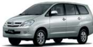
Gambar 1.5 Kijang Generasi Kelima

menggunakan jenis D4D atau juga disebut Direct Four Stroke Turbo Commonrail Injection. Selama sembilan tahun Kijang Innova mengalami facelift sebanyak tiga kali yaitu Kijang Innova facelift pertama (September 2008-30 Juli 2011), Kijang Innova facelift kedua (30 Juli 2011-18 Agustus 2013) dan Kijang Innova facelift ketiga (18 Agustus 2013-November 2015).