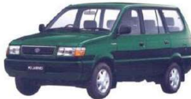
Gambar 1.4 Kijang Generasi Keempat

Brunei Darussalam yang tetap menggunakan nama Kijang, yaitu Malaysia dan Singapura (Toyota Unser), Filipina (Toyota Revo), Taiwan (Toyota Zace surf), Vietnam (Toyota Zace) dan Afrika Selatan (Toyota Condor 4x4).