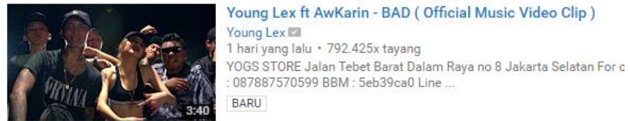
Gambar 1.1 Video Klip BAD di Youtube

(sumber: https://www.youtube.com/user/unclesamindo di akses tanggal 20/09/2016 pukul 14.32 WIB)