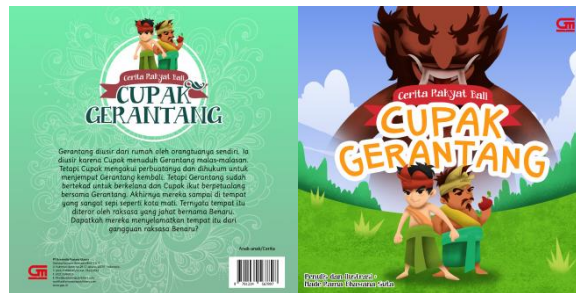
Gambar 3. Cover Buku Cerita