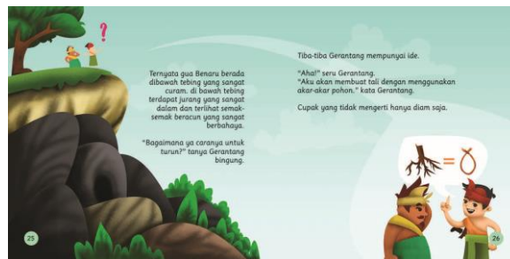
Gambar 4. Halaman 25 – 26