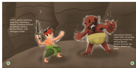
Gambar 5. Halaman 35 - 36