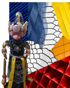
Gambar 3.10 Moodboard Tokoh Bima