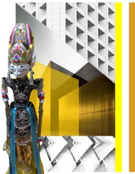
Gambar 3.9 Moodboard Tokoh Yudhistira