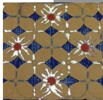
Gambar 3.3 Teknik Cutting Pada Kain Korduroi