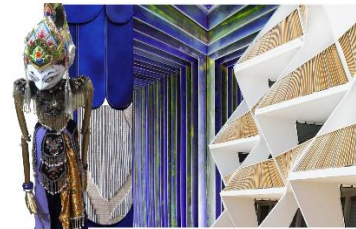
Gambar 3.11 Moodboard Tokoh Arjuna