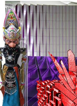
Gambar 3.12 Moodboard Tokoh Duryudana (Sumber: Dokumentasi Pribadi, 2017)