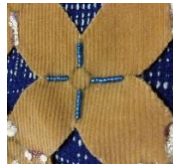
Gambar 3.8 Teknik Payet Pada Kain Korduroi

pada beberapa teknik lain seperti teknik foil, ataupun pada teknik cutting.