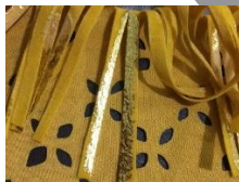
Gambar 3.4 Teknik Cutting Memanjang Pada Kain sued