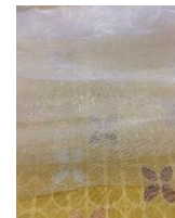
Gambar 3.7 Teknik Layering Pada Kain Organdi