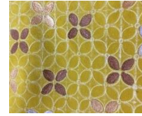
Gambar 3.5 Teknik Lukis Pada Kain Sued

perak dan tembaga sebagai aksan tanda kerajaan. Teknik lukis lebih mudah pengaplikasian daripada cat sablon atau teknik foil karena tidak membutuhkan alat khusus untuk merekatkannya. Alat yang dibutuhkannya pun berupa kuas dan palet.