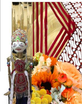
Gambar 3.13 Moodboard Tokoh Drupadi