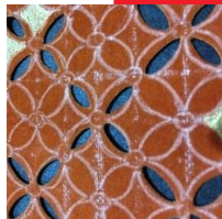
Gambar 3.2 Teknik Cutting Pada Kain Sued