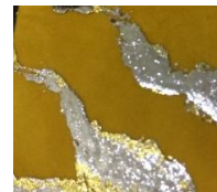
Gambar 3.1 Teknik Sablon Foil