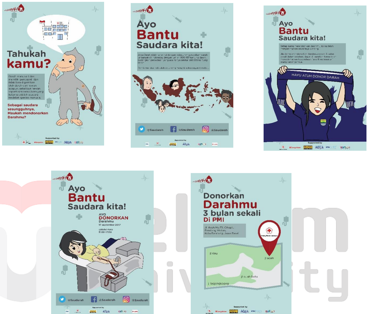
Gambar 3 Rancangan Poster