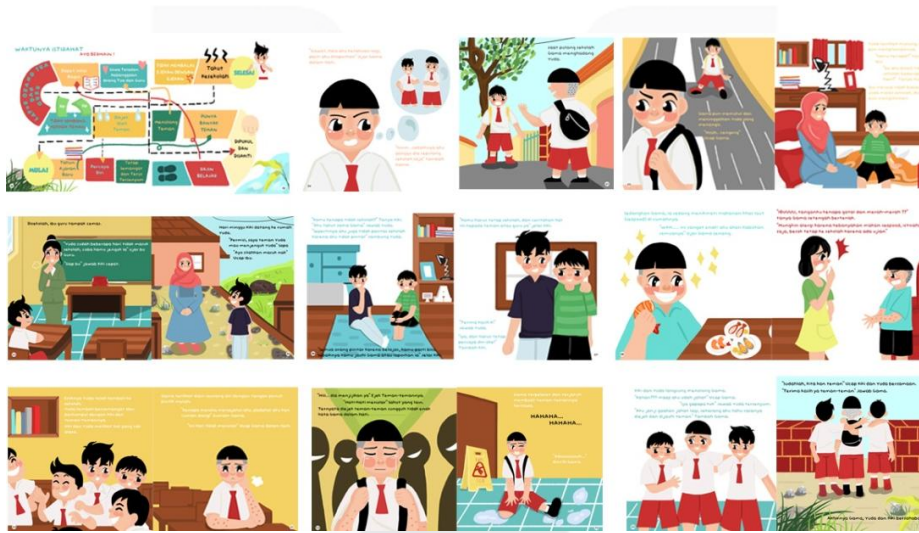
Gambar 6. Halaman Isi II