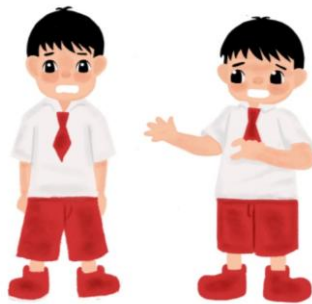
Gambar 3 Karakter Yuda