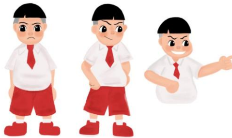
Gambar 2 Karakter Gama