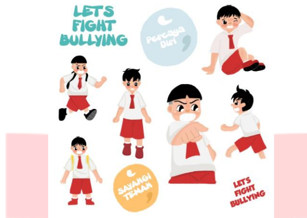
Gambar 8. Profil Penulis