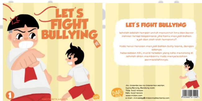
Gambar 4. Halaman Cover