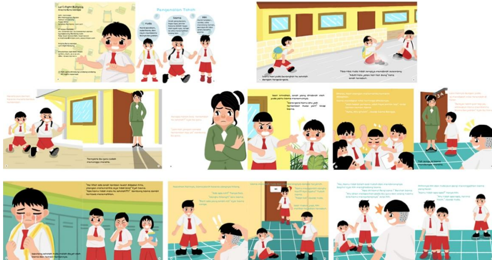
Gambar 5. Halaman Isi I