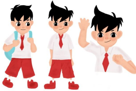
Gambar 1 Karakter Kiki