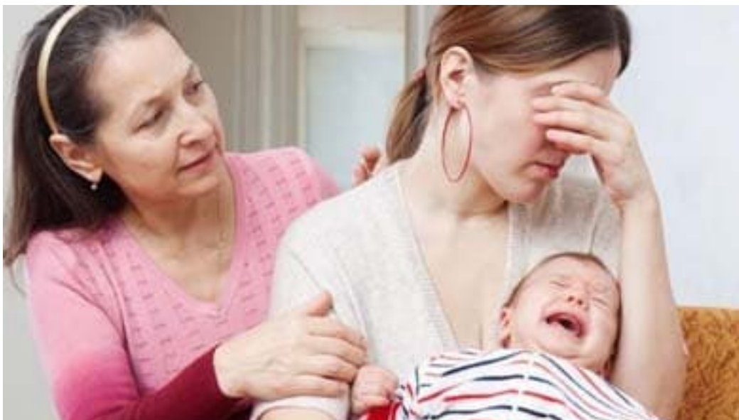
Gambar 2. 1 Contoh Ibu Yang Mengalami Baby blues syndrome

Depresi ini termasuk dalam kategori depresi tingkat rendah sehingga sering tidak teridentifikasi yang menjadi salah satu faktor gejala depresi ini terabaikan. Padahal apabila sang ibu tidak mengetahui atau mengabaikan baby blues syndrome ini dan tidak dapat melewatinya dengan baik akan berdampak pada tingkat depresi lebih lanjut, yaitu depresi postpartum atau yang lebih parah psikosis postpartum .