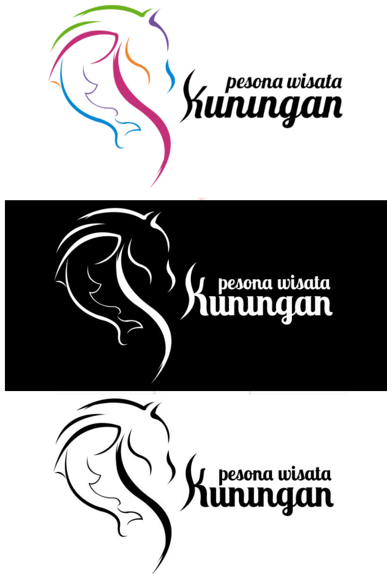
Gambar 2, Perancangan logo pesona wisata Kuningan

sejarah Kuningan, merupakan kuda perang dan alat transportasi yang menjadi ikon utama kabupaten Kuningan, dan ikan dewa merupakan ikan kancra bodas (putih), berada di obyek wisata Cibulan, ikan dewa tersebut terkenal dengan pasukan yang dikutuk oleh prabu Siliwangi, hingga kini ikan dewa masih menjadi misteri yang melekat disebagian besar masyarakat kabupaten Kuningan. Tipografi pada logo menggunakan jenis huruf Lobster two dan dekoratif pada huruf K. Hal tersebut dimaksudkan agar logogram dan logotype terlihat menyatu. Selain itu spesifikasi pada warna lebih beragam agar terkesan ceria.