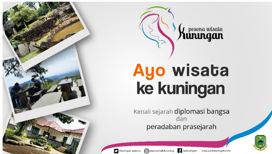
Gambar 3, Rancangan billboard