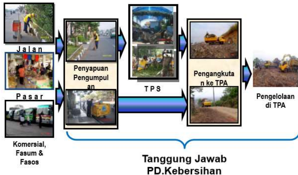
Gambar 2-1: Pola pelayanan dari TPS ke TPA [1]

Sistem operasional pelayanan yang dilaksanakan oleh PD Kebersihan terbagi dalam dua pola yaitu pelayanan yang dimulai dari sumber sampah hingga ke TPA dan pelayanan yang dilakukan mulai dari TPS ke TPA. Disini akan dibahas pola pelayanan yang kedua yaitu dari TPS ke TPA. Pola pelayanan dari TPS ke TPA dapat digambarkan sebagai berikut :