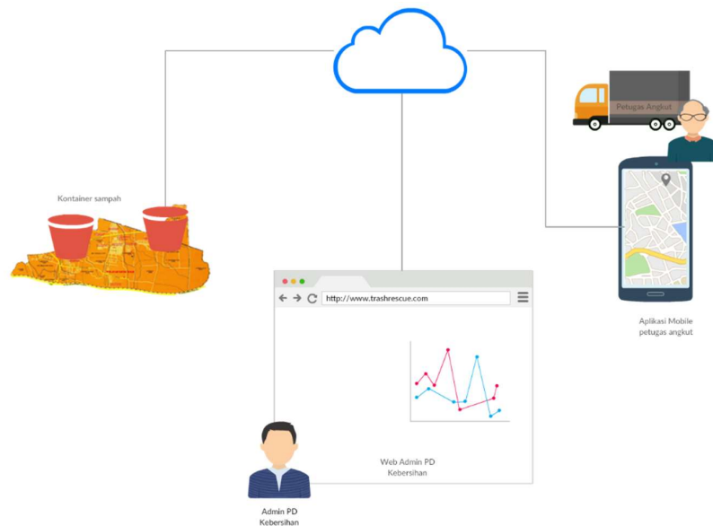
Gambar 3-1: Arsitektur sistem Trash Rescue

Gambar 3-1 menggambarkan arsitektur sistem Trash Rescue :