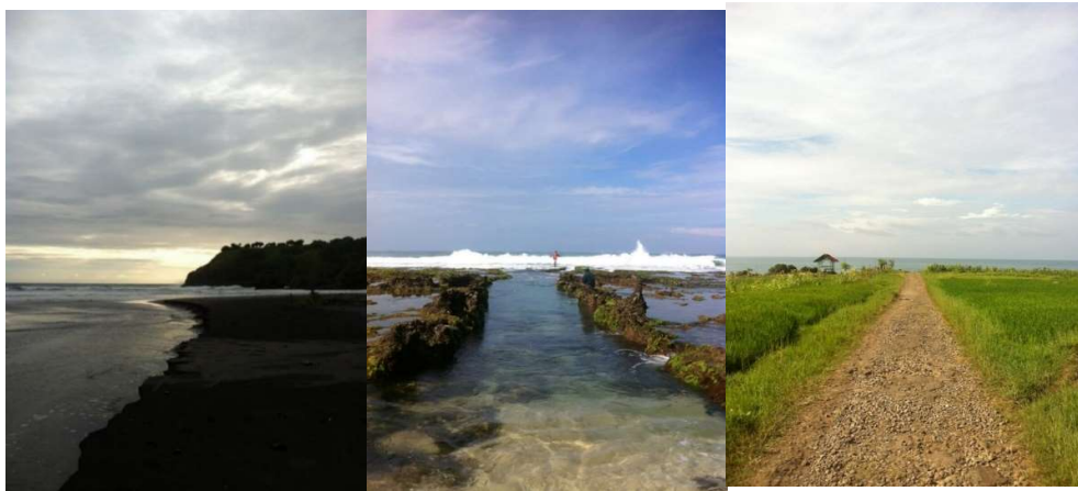
Gambar 1.1 Pemandangan pantai

pemandangan lain diwaktu siang. Namun indahny daerah Rancabuaya tak diiringi dengan pesatnya pembangunan masa kini yang menyebabkan kurangnya fasilitas pendukung. hal seperti ini biasa terjadi mengingat penduduk sekitar Rancabuaya hanya berfokus pada profesinya sebagai pegawai kebun dan nelayan, yang tidak mengetahui cara untuk menginformasikan atau mempromosikan mengenai potensi daerah yang mereka miliki keluar. Hal tersebut memberikan efek samping sepinya daerah Rancabuaya hingga mendatangkan kesan angker dibeberapa sektor didaerah Rancabuaya, ini yang merupakan masalah kurangnya informasi mengenai Rancabuaya menyebabkan minimnya masyarakat luar yang mengetahui adanya Rancabuaya padahal dalam prakteknya Rancabuaya merupakan destinasi wisata yang mampu bersaing dengan daerah destinasi lainnya.