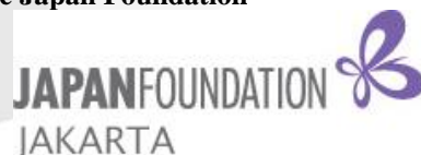
Gambar 2 logo The Japan Foundation Jakarta

The Japan Foundation merupakan organisasi nirlaba semi pemerintahan yang didirikan pada bulan Oktober 1972 di Kansai, Jepang. The Japan