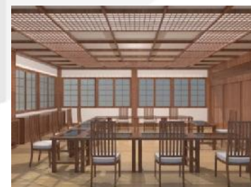
Gambar 3.11. Visualisasi ruang kebudayaan area duduk