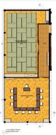
Gambar 3.9 Layout Ruang Kebudayaan

Pada area lantai tiga, denah khusus yang diambil adalah ruang kebudayaan yang memiliki dua area, yaitu area tatami dan area duduk dengan fasilitas yang sama dengan kelas bahasa. Area ini menggunakan tema ruang minum teh, sebagai representasi kegiatan kebudayaan yang paling sering dilaksanakan, yaitu upacara minum teh.