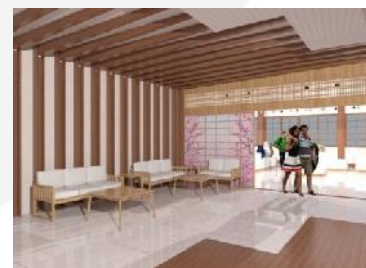
Gambar 3.7 Visualisasi area tunggu

Pada area ini memberikan kesan pertama pada pengunjung tentang identitas The Japan Foundation , serta sebagai jembatan pengunjung untuk mengunjungi fasilitas lainnya. Pada area resepsionis, pengunjung dapat diarahkan menuju galeri yang berada di sebelah lobby utama, dan bagi pengunjung yang berkepentingan dengan petugas kantor dapat langsung dilayani.