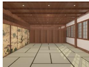
Gambar 3.10 Visualisasi ruang kebudayaan area tatami