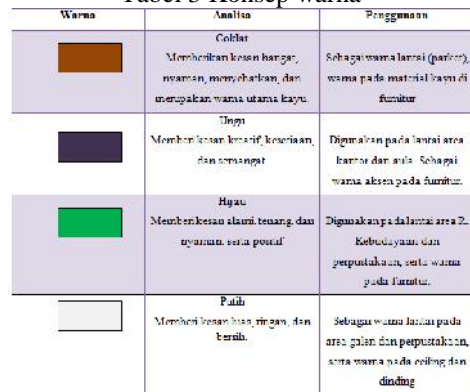
Tabel 3 Konsep warna

Warna merupakan salah satu elemen penting dalam desain interior. Selain memperindah tampilan ruangan, keberadaan warna juga dapat menjadi alat terapi psikologis karena bisa mempengaruhi suasana (mood) ruangan dan juga mood bagi yang ada di ruangan tersebut. Warna yang diterapkan berupa warna netral seperti putih dan krem serta warna terang yang digunakan pada furniture kayu. Penggunaan warna gelap juga digunakan sebagai aksent agar ruangan lebih hidup dan segar.