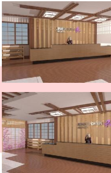
Gambar 3.8 Visualisasi area resepsionis