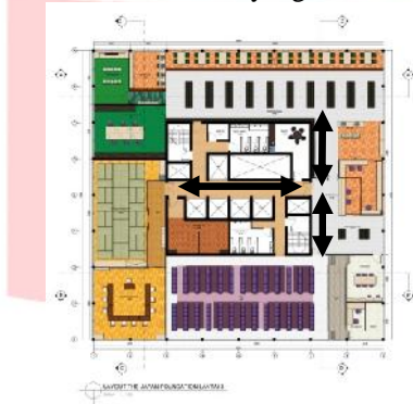
Gambar 3.5 ilustrasi sirkulasi linear lantai 3

Sistem sirkulasi yang digunakan adalah sirkulasi linear, dimana pengunjung yang masuk dan keluar di area yang sama.