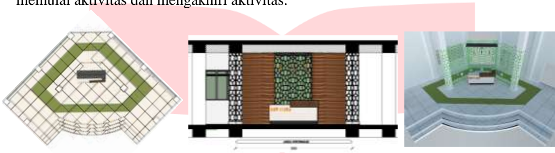
Gambar 3 Area Lobby

Pada area lobby hanya terdapat area informasi, yang fungsi utamanya adalah untuk memberikan informasi kepada visitor. Selain itu juga area lobby berfungsi untuk absensi para guru dan staff. Penempatan absensi di lobby yaitu untuk memudahkan user dalam memulai aktivitas dan mengakhiri aktivitas.