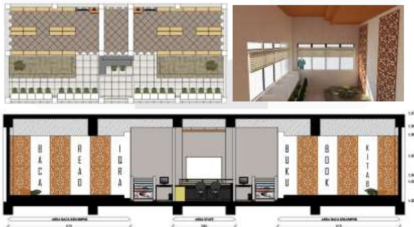
Gambar 6 Area Perpustakaan Sumber : Karya Penulis

Pada area perpustakaan meliputi beberapa fungsi ruang, yang fungsi utamanya sebagai sarana membaca siswa/i. Adapun area tersebut adalah, area staff, area buku, dan area baca. Area staff juga sebagai area informasi, yang berfungsi untuk memberikan informasi meminjam mengembalikan buku atau menanyakan hal lainnya. Pada area staff juga terdapat ruang untuk menjaga kualitas buku. Area buku terdiri dari rak - rak untuk menyimpan buku. Pada area membaca terdiri dari 2 bagian. Yaitu area membaca individu dan area membaca kelompok.