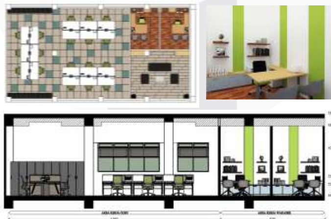
Gambar 4 Ruang Guru

Pada area guru meliputi beberapa fungsi ruang, yang fungsi utamanya adalah sebagai sarana kerja dan istirahat para guru. Adapun area tersebut adalah, area tamu, area wakasek, dan area guru. Area tamu berfungsi untuk menerima tamu yang berasal dari wali murid. Area wakasek merupakan area kerja wakasek untuk melakukan pekerjaan sebagai wakasek dan terbagi menjadi 2 ruangan. Yaitu ruangan wakasek kurikulum, dan wakasek kesiswaan. Sedangkan area guru merupakan area kerja guru untuk melakukan sebagian aktivitas selama di sekolah.