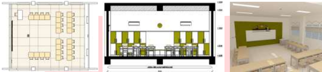
Gambar 5 Area Kelas

Pada area kelas hanya terdapat area belajar mengajar, yang fungsi utamanya adalah sebagai area belajar mengajar secara teori. Area kelas terdiri dari area untuk guru, untuk siswa/i, dan area penyimpanan.