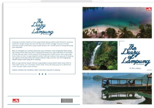
Gambar 3 Cover Buku