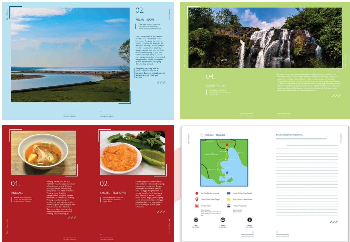
Gambar 5 Isi Buku

Isi dari buku panduan wisata terdapat foto objek wisata, foto makanan khas Lampung, dan peta menuju tempat wisata yang ada. Selain itu, terdapat kata – kata sebagai informasi dan penjelasan dari foto yang ada dalam layout buku tersebut.