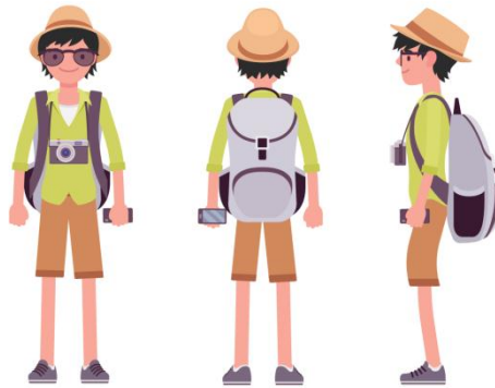
Gambar 1 Desain Karakter