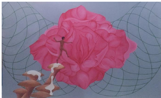
Gambar 3.13 karya 3 (Obstructed By Reality), acrylic on canvas, 120cm x 200cm.

Jika dilihat secara singkat kita akan melihat sebuah bunga berwarna merah muda yang begitu besar terletak di tengah-tengah lukisan, namun jika kita lihat dengan seksama penulis memberikan sedikit perubahan terhadap bunga tersebut yaitu tepat di bagian mahkota bunga yang digantinya dengan bentuk kelamin wanita, dan garis lengkung atau curves yang membentuk paha, yang jika dilihat secara keseluruhan kita akan melihat seorang wanita yang sedang membuka kakinya dengan lebar.