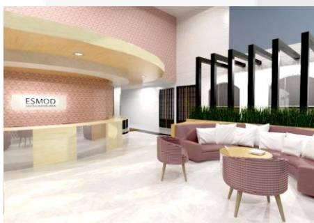
Gambar 4.7 Area Lobby