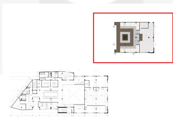
Gambar 4.2. Denah General dan Khusus lantai dua