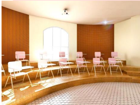
Gambar 4.3. Ruang Kelas

Konsep tata ruang yang diterapkan adalah bentukan organis, bentukan dinamis dan geometris yang berguna untuk mempertegas bentuk pada setiap ruangan. Pada beberapa partikel juga diadopsinya bentuk organis agar terciptanya keharmonisan dan kelarasan pada bentuk desain dan juga bentuk ini memberikan kesan yang berirama dan tidak kaku. Bentuk organis dapat diaplikasikan ke beberapa objek ruangan. Konsep tata ruang ini juga mengutamakan aspek kemudahan dalam menjangkau sesuatu dan bagaimana mereka dapat menangkap pelajaran dengan optimal. Hal ini dapat terlihat dari penataan area ruang dan furniture. Sehingga aktivitas user menjadi lebih efisien dan efektif.