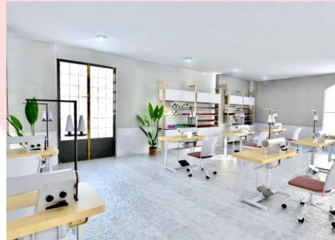
Gambar 4.4 Ruang Kelas Jahit