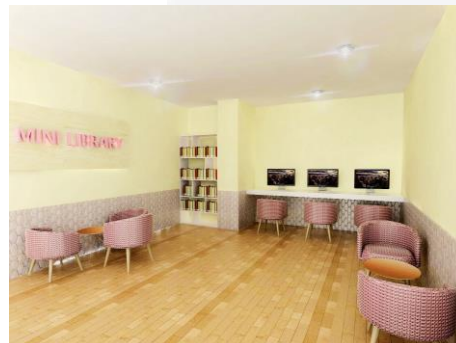
Gambar 4.6 Ruang Perpustakaan