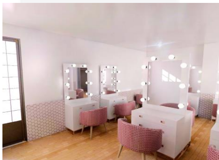
Gambar 4.5 Ruang Make Up