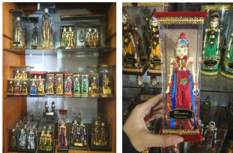
Gambar 1. 1 Kemasan Wayang di Gallery Cupumanik

Dari kemasan yang digunakan untuk wayang golek tersebut dirasa masih kurang menarik serta kurang menggambarkan karakter dari setiap tokohnya khususnya wayang Astrajingga, karena semua wayang menggunakan bentuk kemasan yang sama. Pembeda dari setiap kemasan yaitu hanya menambahkan nama tokoh wayang yang ditempelkan dibagian depan kemasan.