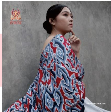
Gambar 4 Booklet

Media Utama booklet mencakup pemahaman mengenai esensi batik, bagaimana proses pembuatan batik, lalu membahas batik trusmi yang merupakan mula terbentuknya Batik Komar, ada pula profil pendiri serta pembahasan ringkas mengenai Batik Komar dan kegiatan di dalamnya