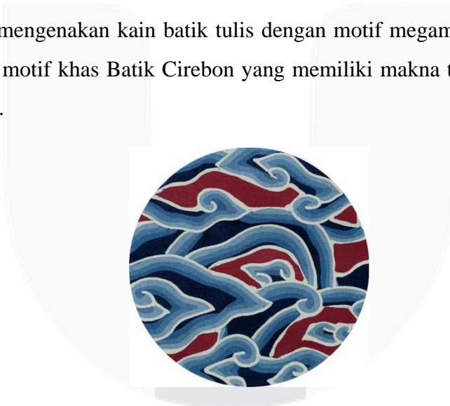
Gambar 3 Motif Megamendung

Foto model mengenakan kain batik tulis dengan motif megamendung, megamendung sebagai salah satu motif khas Batik Cirebon yang memiliki makna transidental (ketuhanan) yang amatlah khas.