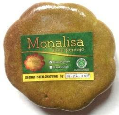
Gambar 1Kemasan Bolu Kemojo Monalisa

Mona memulai bisnis nya pada awal Februari 2007 awalnya beliau hanya menitipkan ke swalayan terdekat saja, tetapi dengan banyaknya pembeli maka swalayan tersebut menghubungi Mona bahwa produknya laku terjual dengan cepat. Mona bisa memproduksi bolu kemojo sehari 20 loyang yang awalnya hanya memiliki satu varian rasa, rasa pandan tetapi Mona membuat varian rasa baru yang masyarakat umum sudah kenal yaitu rasa durian. Bolu Kemojo Monalisa dipasarkan di swalayan dan toko oleh-oleh. Produk bolu kemojo Monalisa memiliki dua variasi rasa yaitu rasa durian dan pandan.