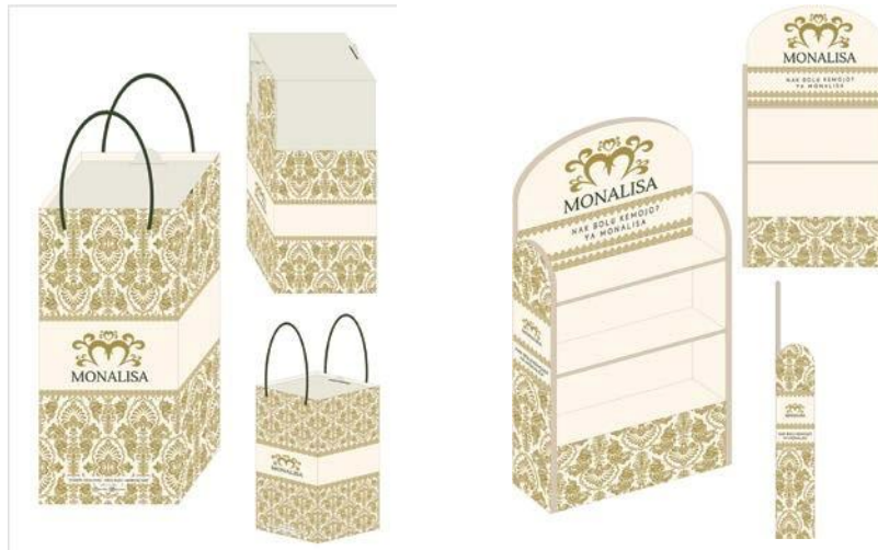
Gambar 4 hasil perancangan

Logo yang dibuat menggunakan motif pucuk rebung dengan mengambil beberapa ornamen yang terdapat pada motif pucuk rebung, pemilihan motif tersebut karena masyarakat tidak asing lagi dengan motif pucuk rebung. Kata M pada logo menggambarkan bahwa kata dari “Monalisa” sehingga masyarakat yang melihatnya dengan mudah mengingat logo Monalisa. Kemasan utama dibuat untuk melindungi produk agar tidak mudah rusak dan memudahkan pembeli untuk memegang kemasannya tanpa langsung menyentuh produk tersebut. Kemudian Secondary packaging memudahkan konsumen jika membeli lebih dari 3 karena secondary packaging mengkhususkan untuk bolu kemojo jika membeli 5 bolu yang akan di kemas dengan menggunakan secondary packaging, sehingga memudahkan konsumen jika membeli untuk diberi sanak saudara sebagai oleh-oleh khas Riau. Dan Display produk dibuat untuk memudahkan konsumen membeli bolu kemojo tanpa harus mencari dibagian mana bolu kemojo dijual, karena bolu kemojo masih hanya dititipkan di toko oleh-oleh saja belum memiliki toko sendiri maka dibuatlah display produk khusus untuk bolu kemojo Monalisa.