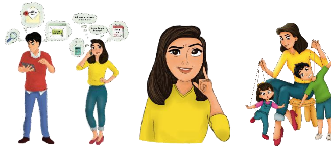
Gambar 5 Hasil Pewarnaan Ilustrasi