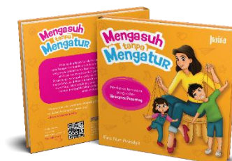
Gambar 7 Hasil Perancangan Akhir Buku Mengasuh tanpa Mengatur

Setelah perancangan selesai, penulis memeriksa kembali kumpulan file yang telah dirancang dan merapikannya, lalu digabung menjadi format pdf yang siap dicetak. Karya pun dicetak dengan teknik jilid lem punggung dan judul buku 'Mengasuh Tanpa Mengatur' pada sampul depan diberikan sentuhan uv varnish.