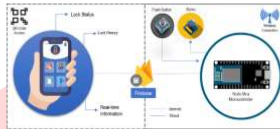
Gambar 1 Gambaran Umum Aplikasi My Door.

sedang terbuka atau tertutup. Konsep dari aplikasi My Door dapat digambarkan pada Gambar 1.