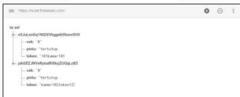
Gambar 5 Firebase Real Time Database

Pengujian ini dilakukan untuk memastikan data yang dikirim oleh user bisa tersimpan di Firestore Real Time Database . Hal tersebut bertujuan untuk mempermudah sistem dalam pengambilan dan penyimpanan data secara real time .