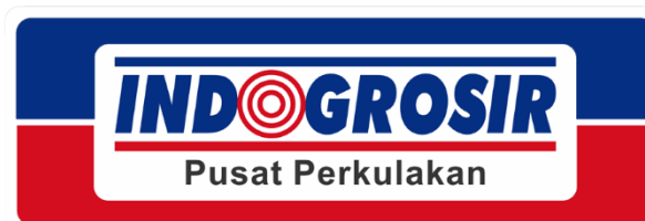
Gambar 1.1 Logo Indogrosir Samarinda

Logo perusahaan yang melambang brand atau citra perusahaan yang menjadi identitas bagi perusahaan. Gambar 1.1 menunjukkan logo Indogrosir Samarinda.