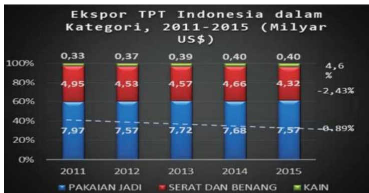
Gambar I.1 BPS dalam Ekspor TPT 2011-2015

Badan Pusat Statistik (BPS) menyatakan bahwa 18% dari industri tekstil dan pakaian memiliki pertumbuhan paling tinggi. Produksi sektor industri pakaian memiliki kenaikan hingga 29,19% karena permintaan pesanan dari pasar ekspor. Direktur Industri Tekstil, Kulit, dan Alas Kaki Kementerian Perindustrian (Kemenperin) mengatakan bahwa industri tekstil dan produk tekstil (TPT) adalah salah satu sektor andalan yang memberikan kontribusi besar dalam perekonomian nasional. Berikut merupakan data yang didapatkan mengenai ekspor TPT di Indonesia pada tahun 2011-2015.