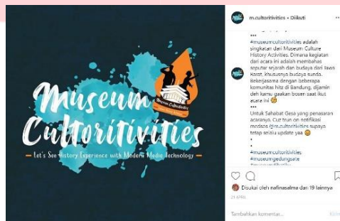
Gambar 3.4.10 Hasil Rancangan Hastag pada social media