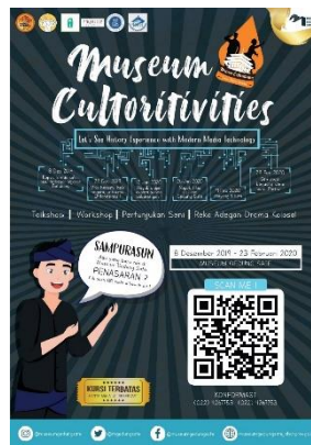
Gambar 3.4.3 Hasil Rancangan Poster Utama