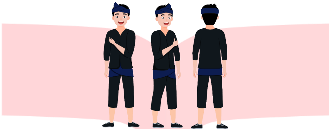
Gambar 3.4.2 Hasil Rancangan Maskot dari Program Tematik Museum Cultoritivities