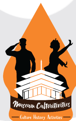
Gambar 3.4.1 Hasil Rancangan Logo Program Tematik