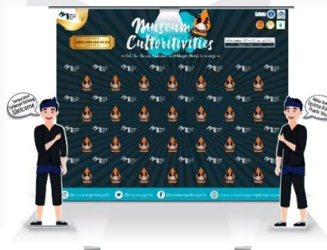
Gambar 3.4.10 Hasil Rancangan Photobooth