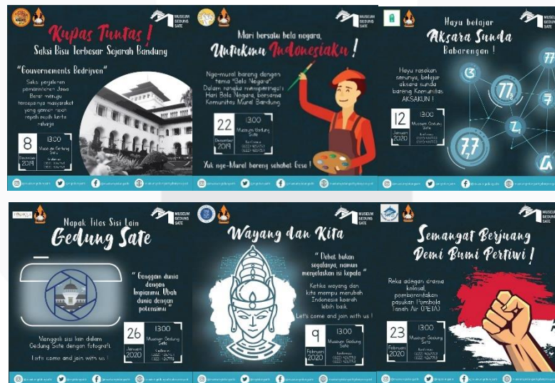
Gambar 3.4.4 Hasil Rancangan Poster Tematik