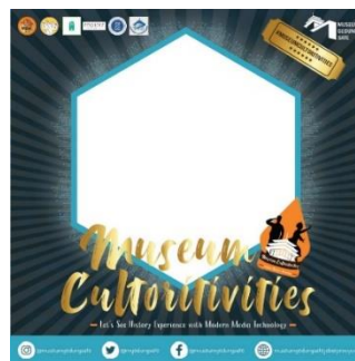
Gambar 3.4.11 Hasil Rancangan Twibbon