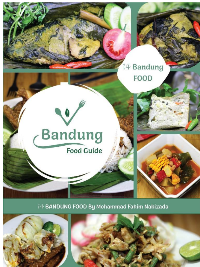
Gambar 4.5 Cover Buku

Proses pertama dalam pembuatan cover buku ini adalah membuat berberapa contoh alternarif desian yang di buat secara digital ilustrasi. Gunanya untuk mendapatkan hasil desian yang sesuai dengan konsep visual yang akandigunakan setelah melewati beberapa revisi.