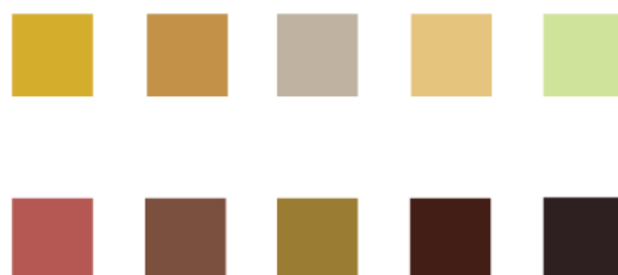
Gambar 4.3 Skema warna

Skema warna diambil sebagian besar dari yang terkait dengant kuliner kuilner khas kota Bandung contohnya warna.