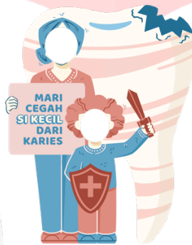
Gambar 10. Photobooth