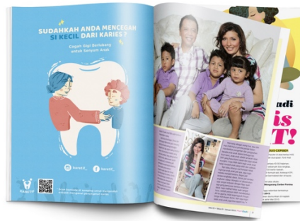
Gambar 13. Mock Up Iklan Majalah