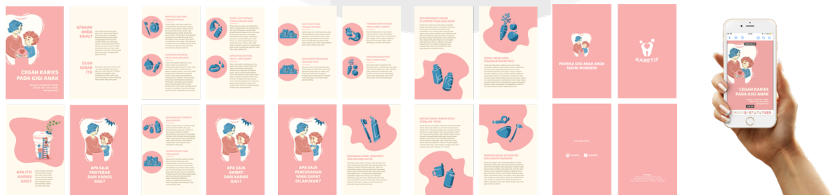
Gambar 4. E-book