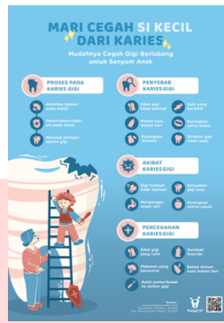
Gambar 5. Infografis