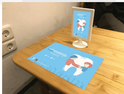
Gambar 12. Mock Up Table Standing Sign dan Placemat