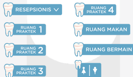
Gambar 11. Signage