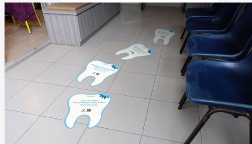
Gambar 7. Mock Up Sticker Lantai