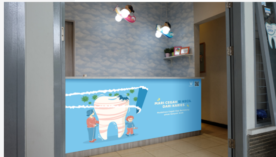
Gambar 3. Mock Up Meja Resepsionis