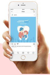
Gambar 9. Mock Up Konten Media Sosial