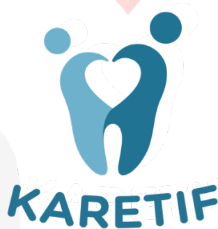
Gambar 14. Logo