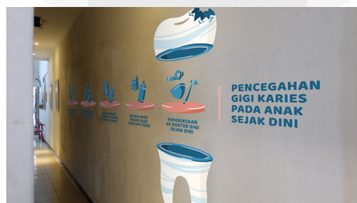
Gambar 8. Mock Up Sticker Dinding