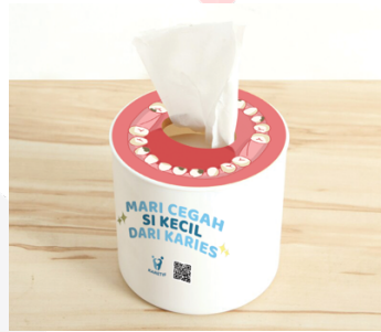
Gambar 2. Ambient Media Tempat Tisu