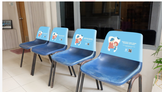
Gambar 6. Mock Up Kain Kursi