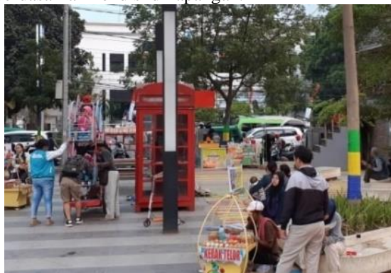
Gambar 2 : Dokumentasi Perpustakaan Mini Alun – alun Ujungberung

Dokumentasi berfungsi sebagai pelengkap dari data lapangan dan proses wawancara. Berikut merupakan hasil dari dokumentasi yang penulis peroleh berdasarkan kondisi di lapangan.