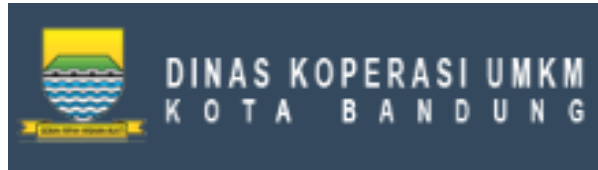
Gambar 1. 1 Dinas Koperasi dan UMKM Kota Bandung