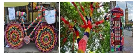
Gambar 2. Karya seni crochet

Selain perkembangan dalam fashion teknik crochet juga digunakan sebagai interior rumah, boneka dan sebagai seni lainnya.