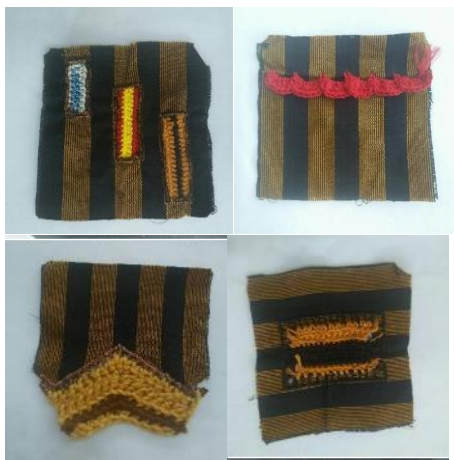
Gambar 8. Eksplorasi Awal

Lalu pada penelitian ini, penulis melakukan beberapa tahap proses eksplorasi untuk mencari warna, material dan teknik yang penghubung antara crochet dan kain.