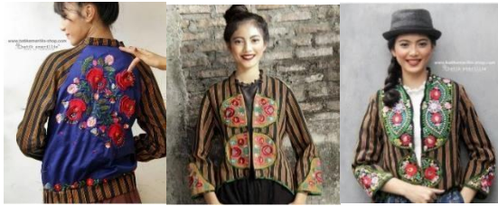
Gambar 6. Batik Amarilis

Batik amarilis adalah sebuah brand yang menggunakan teknik bordir sebagai ciri khasnya dan juga menggabungkan dengan kain tradisional.