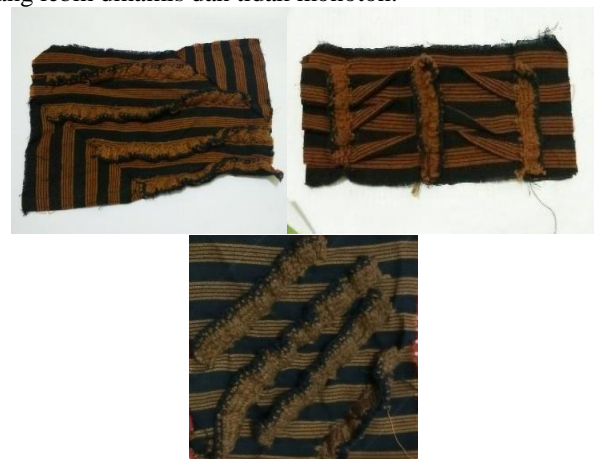
Gambar 10. Eksplorasi Terpilih

Pada eksplorasi lanjutan terpilih teknik triple crochet increase dan single crochet decrease penggabungan dua teknik tersebut membuat hasil crochet lebih nyata (3D) dan adanya penambahan efek highlight untuk mempertegas visual crochet . selain itu adanya pengembangan dari letak posisi crochet yang berlawanan dengan arah lurik memberi kesan yang lebih dinamis dan tidak monoton.