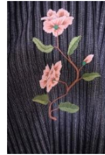
Gambar 3. Lurik Sulam