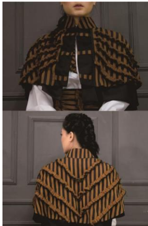
Gambar 12. Crochet diagonal melawan arah lurik