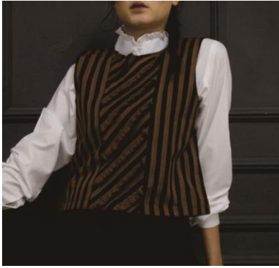
Gambar 11. Crochet searah garis lurik