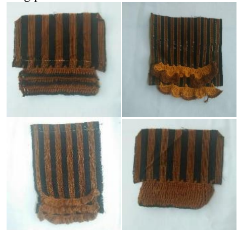
Gambar 9. Eksplorasi lanjutan

Pada eksplorasi lanjutan material yang digunakan adalah benang katun bali karena memiliki tekstur yang paling baik dan halus dan warna yang digunakan adalah warna yang senada dengan kain untuk mempertahankan kesan sederhana lurik tersebut. Dan juga menggunakan solder untuk membuat lubang penghubung pada kain