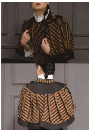
Gambar 13. Crochet vertikal melawan arah lurik