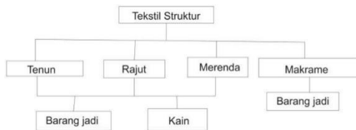
Bagan 1. Skema Mapping Reka Rakit