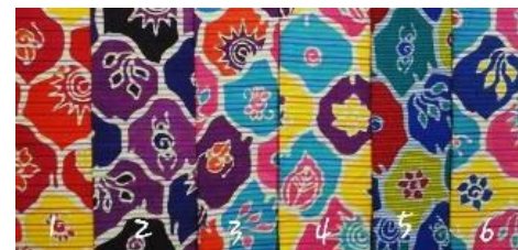
Gambar 5. Lurik Lukis Anisa