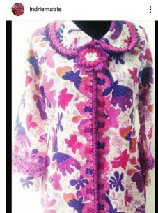
Gambar7. Crochet batik

Dan dari hasil observasi pernah ada yang mengkombinasikan teknik structure yaitu crochet dengan kain batik, tetapi pengaplikasiannya masih minim, hanya diaplikasikan pada tepian saja.