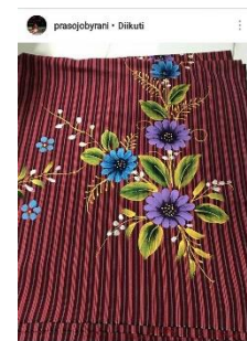
Gambar 4. Lurik Lukis