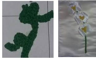
Gambar 2. Eksplorasi