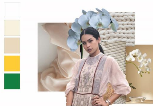
Gambar 1. Imageboard

Berdasarkan hasil analisa dan eksplorasi, konsep untuk penelitian ini terinspirasi dari bunga Anggrek Bulan yang merupakan Bunga Nasional Indonesia dan ditetapkan sebagai Puspa Pesona karena filosofi yang dimiliki oleh bunga Anggrek Bulan.