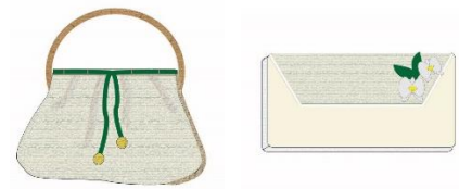
Gambar 3. Sketsa Desain