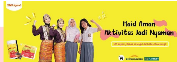
f. Poster Digital