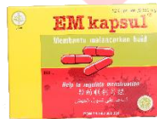
Gambar 3.3 Bentuk Kemasan Strip EM Kapsul