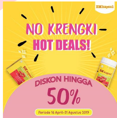
g. Poster Sales Promotion