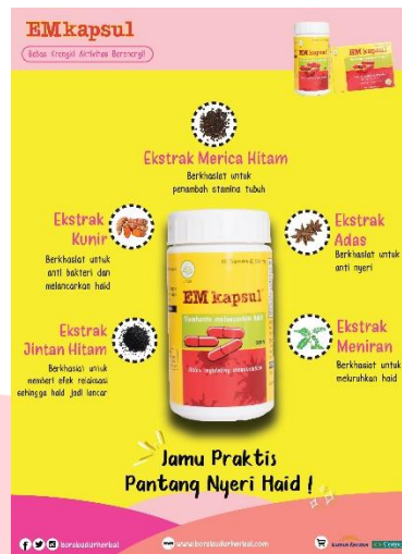
c. Poster Produk