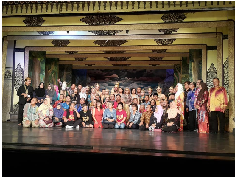
Gambar 1.2 Javanese Diaspora Event IV