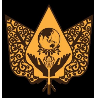
Gambar 1.1 Logo Komunitas Diaspora Javanese