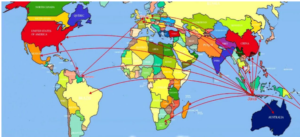
Gambar 1.3 Persebaran Komunitas Diaspora Javanese