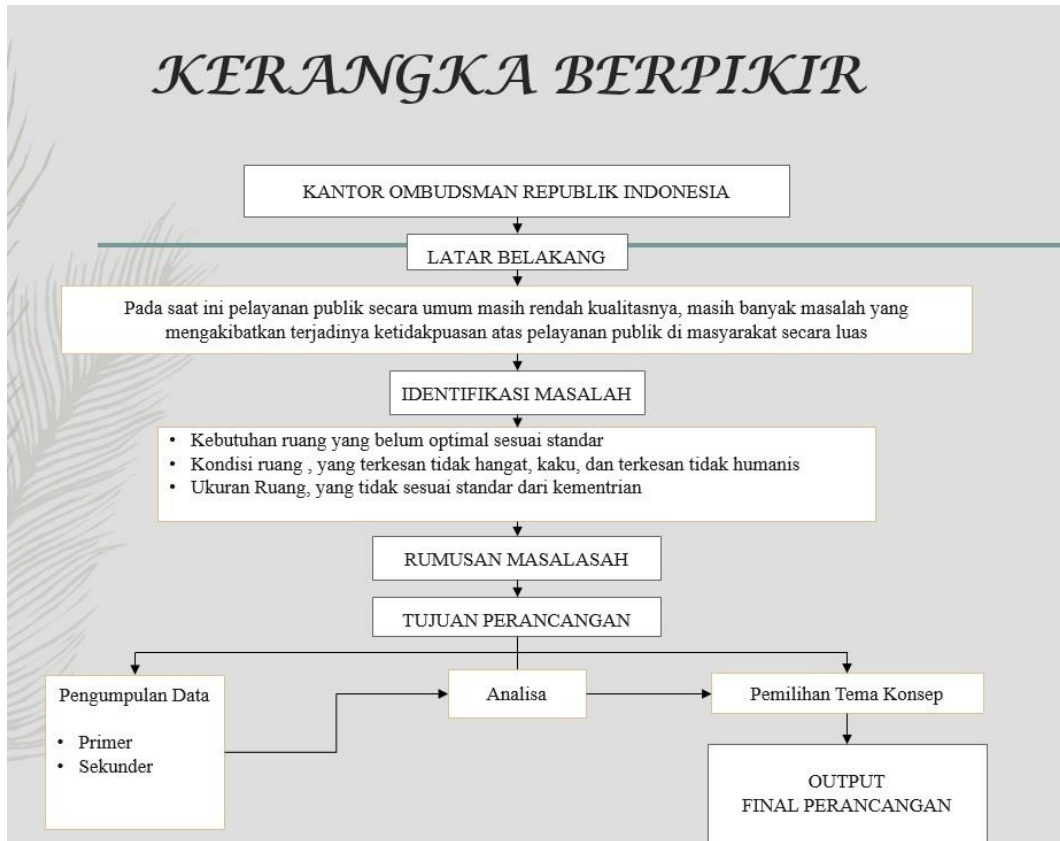
Gambar 1.1 Bagan Kerangka Berpikir